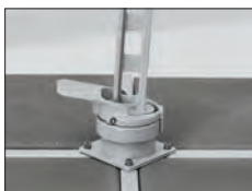
Ständerkreuz / Drehfuss Crosswise pole base / Turnable base Pied en croix / Pivotant