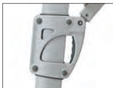
Schieber Slide Coulisseau