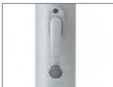
Kurbel Crank Manivelle