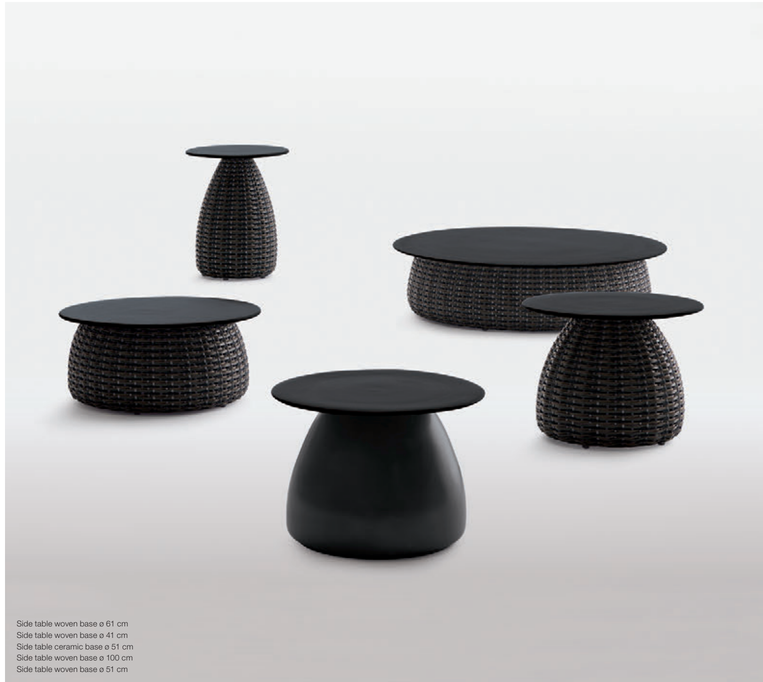
Side table woven base ø 61 cm Side table woven base ø 41 cm Side table ceramic base ø 51 cm Side table woven base ø 100 cm Side table woven base ø 51 cm