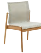
8202B TEAK STACKING CHAIR

Buffed finish teak & powder coated stainless steel frame. Sing seat & back.