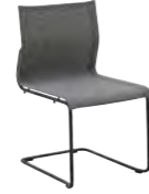
8200 STACKING CHAIR

Powder coated stainless steel frame. Buffed finish teak arms. Sing seat & back.