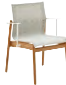
8203B TEAK STACKING CHAIR WITH ARMS

Powder coated stainless steel frame. Sing seat & back.