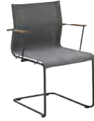
8201 STACKING CHAIR WITH ARMS